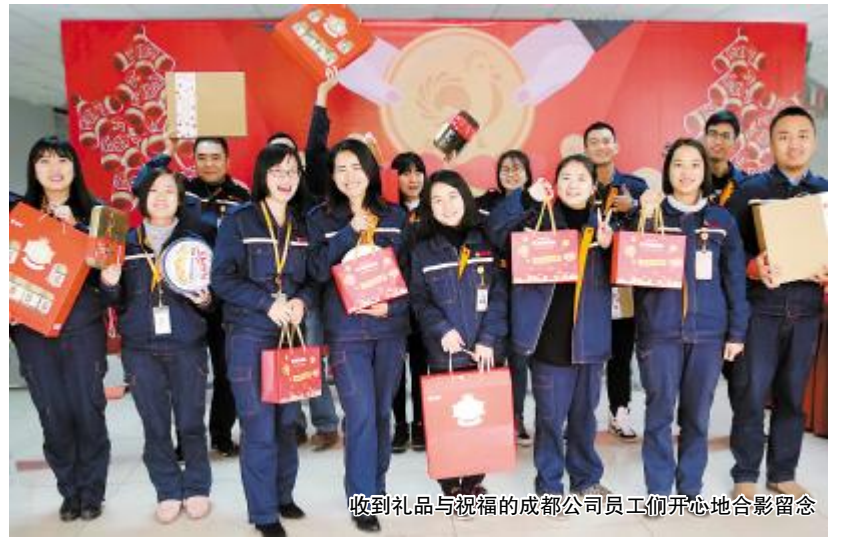
收到礼品与祝福的成都公司员工开心地合影留念