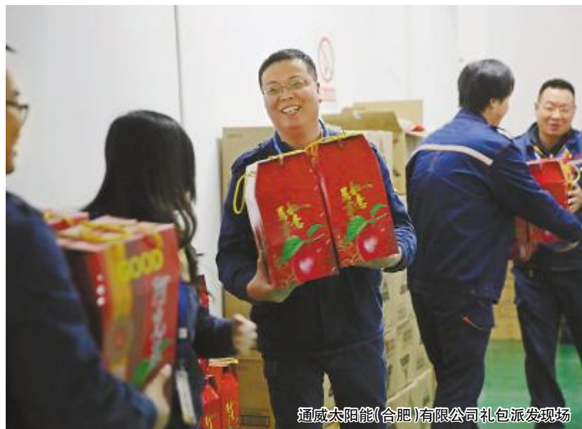
通威太阳能(合肥)有限公司礼包派发现场

本报讯 (通讯员 叶婷婷 杨晶)金猴辞岁,金鸡报晓。为庆祝农历新年的到来,通威太阳能合肥、成都两地开展“新春年货”大派送、新春纳红等活动,让员工感受到春节的欢乐与温馨。 1月23日(腊月二十六),距离中国传统节日农历新年还有4天时间,通威太阳能(合肥、成都)有限公司开展了热闹非凡的“新春年货”大派送活动。 早在一个月前,两地公司便开始着手为员工采购新春礼品。当天一大早,三辆满载着“新春年货”的大货车缓缓驶入合肥公司厂区,在行政部员工的指引下,大货车先后来到电池生产车间、组件厂以及行政楼,伴随着一声声亲切的问候、一句句深情的祝福,可口的水果、香甜的曲奇、品种多样的坚果大礼包被送到员工手中,大家欢笑着,感受着公司的关怀与温暖。