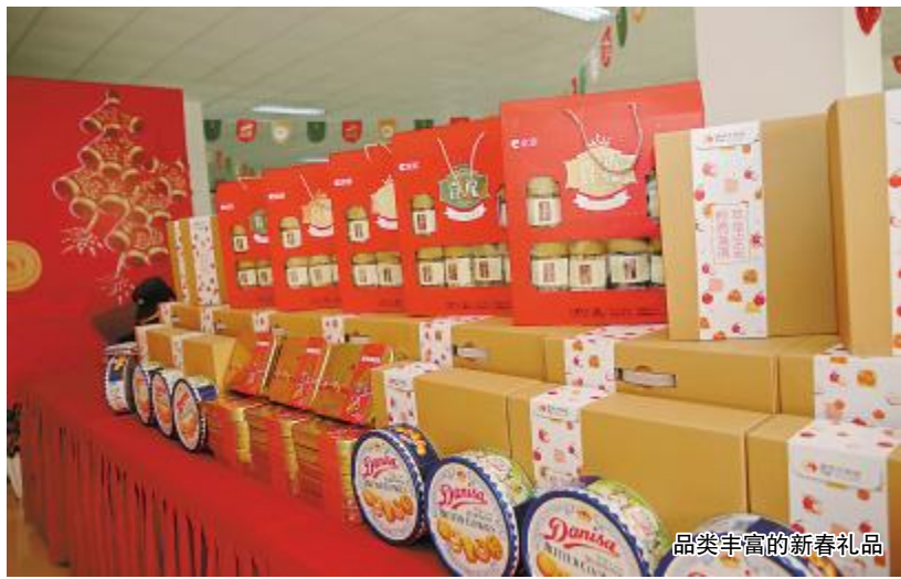
品类丰富的新春礼品