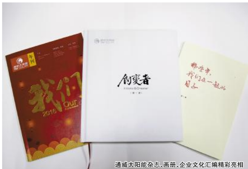
通威太阳能杂志、画册、企业文化汇编精彩亮相