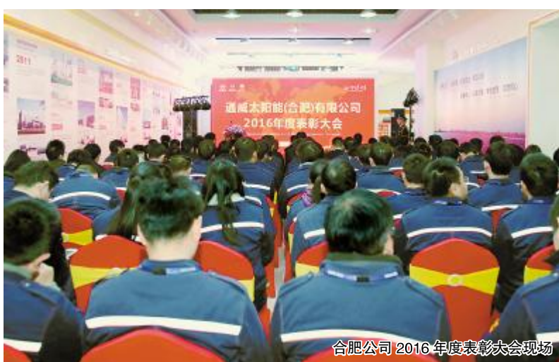
合肥公司 2016 年度表彰大会现场