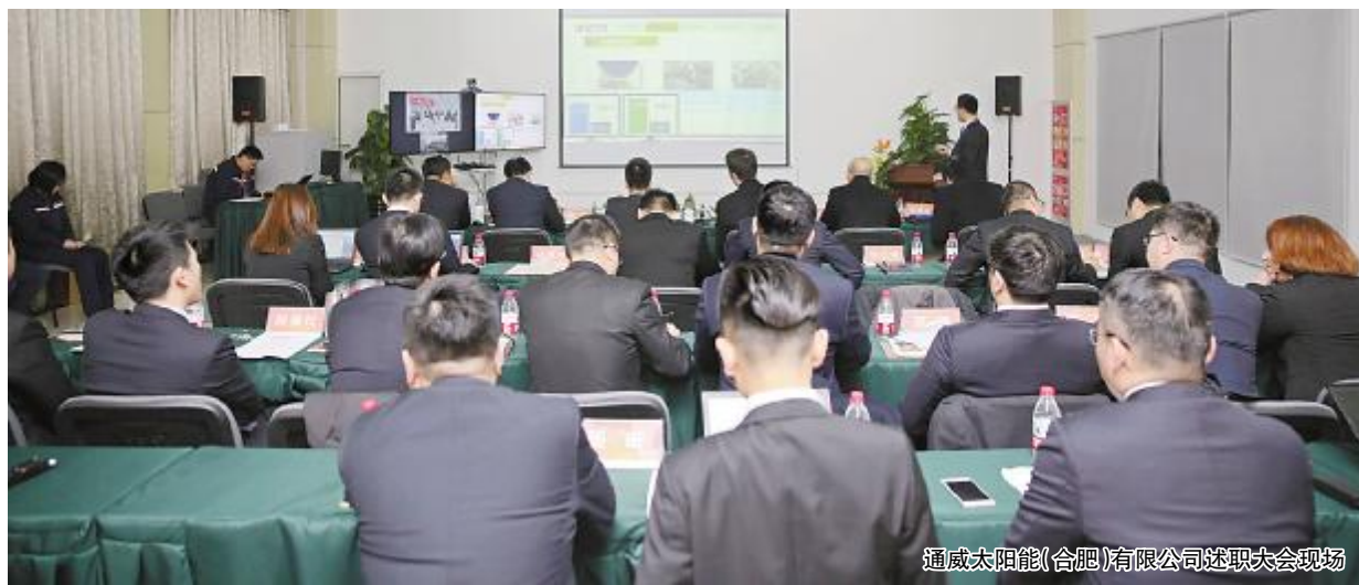
通威太阳能(合肥)有限公司述职大会现场